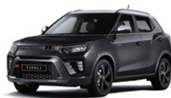
Space Black - 2tone