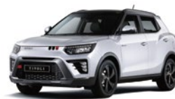
Grand White - 2tone