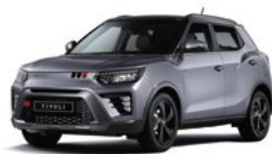
Iron Metal - 2tone