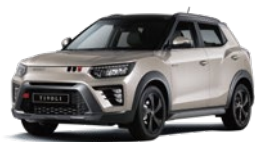
Latte Greige - 2tone