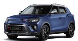
Dandy Blue - 2tone