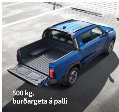
500 kg. burðargeta á palli