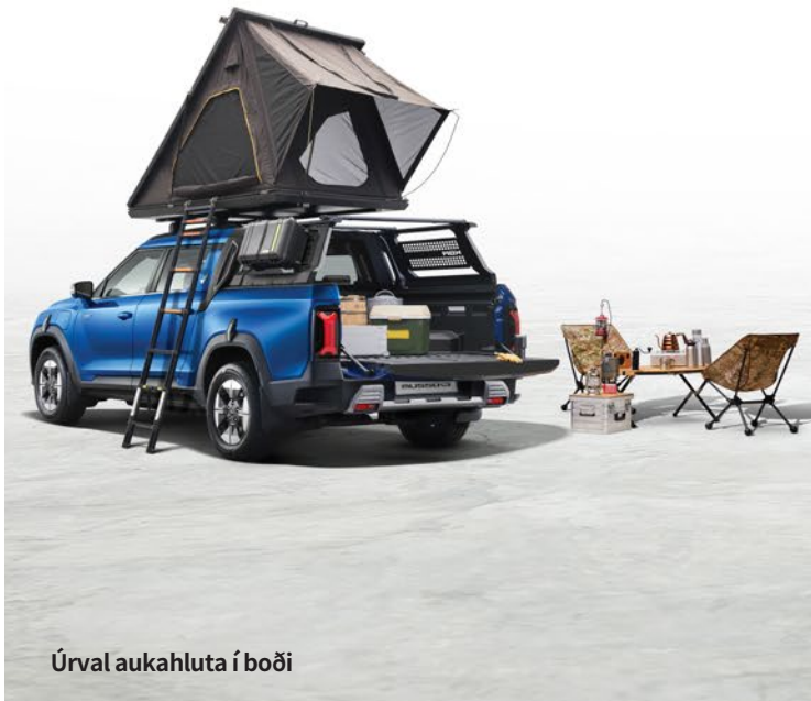
Úrval aukahluta í boði