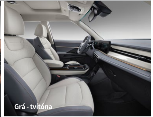
Grá - tvítóna