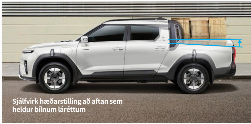
Sjálfvirk hæðarstilling að aftan sem heldur bílnum láréttum