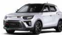
Grand White - 2tone