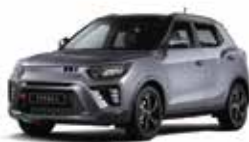
Iron Metal - 2tone