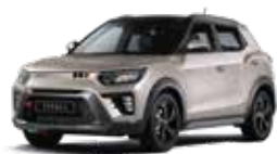
Latte Greige - 2tone