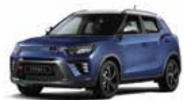
Dandy Blue - 2tone