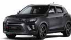
Space Black - 2tone