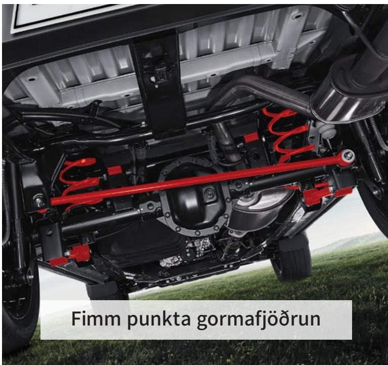
Fimm punkta gormafjöðrun