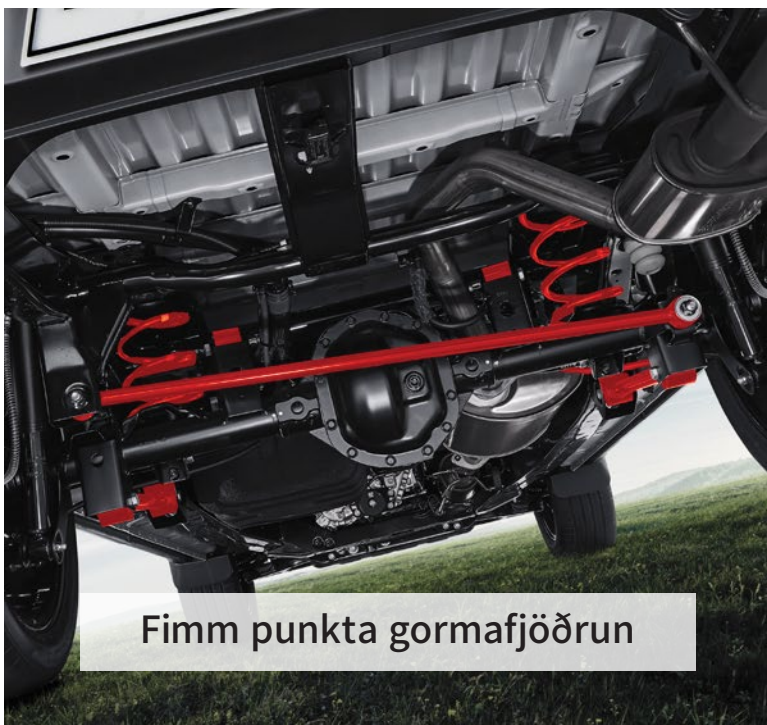
Fimm punkta gormafjöðrun