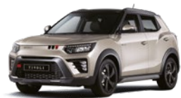
Latte Greige - 2tone