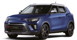
Dandy Blue - 2tone