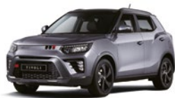
Iron Metal - 2tone