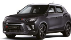
Space Black - 2tone