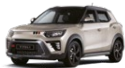
Latte Greige - 2tone