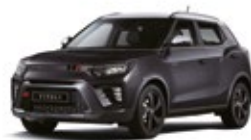
Space Black - 2tone