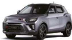
Iron Metal - 2tone