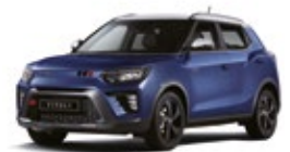
Dandy Blue - 2tone