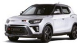
Grand White - 2tone